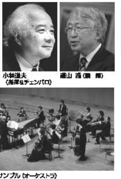
松本パツハ祝祭アンサンブル(オーケストラ)

松本市市制施行100周年を記念して結成された松本パツハ祝祭アンサンブルは、古楽(オリジナル楽器)のオーケストラです。日本音楽界の重鎮、小林道夫の弾き振り、コンサートマスターは松本の才能教育で学んだ桐山建志が務めます。2012年には東京文化会館、アクロス福岡、札幌コンサ