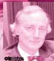
リェック・ドヴャース (ピアノ)