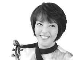
堀米ゆず子(ヴァイオリン)

1980年エリーザベト王妃国際音楽コンクール で日本人初の優勝を飾って以来、ベルリン・フイ ル、ロンドン響、シカゴ響、アバド、小澤征爾 ラトルなど世界一流のオーケストラ、指揮者との 共演を重ねるとともに、アルゲリッチ、クレーメル 、マイスキー、メネセス、ルイ・サダ、エルル パシヤなど多彩な共演者と室内楽にも熱心に取り 組んでいる堀米ゆず子が、銘器グアルネリ・デ ル・ジェス（1741年製）を携えて来松します。 共演者はピアノの名手リュック・ドゥヴォス、N 響コンサートマスターの山口裕之他。2大Bの名 曲ぞろいの演奏会です。