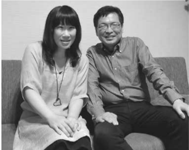
※1 イング・ゴリツキ(1939-)ドイツのオーボエ奏者 ※2 リード(※2) 葉(あし)、竹、木、金属などでつくられた弾力性に富む薄片で、おもに管楽器の喉口にはめ込んで吹奏される。

A リード(※2)が出来上がっていく体験は、あまり好きじゃないですけどね(笑)。あれも生き物ですから、毎日仲良くしていると、リードも仲良くしてくれるかな、みたいなところはありますね。 K いつもテレビで拝見していて、速くの存在だったんですけれども、共感できるところが沢山あって嬉しかったです。 A みなさんも頑張つて、オーボエを吹いてください。 K このホールは私たちのホームですが、ホールと、松本の印象について、お聞かせください。 A 実を言いますと、観光で松本に来たことは、全くないので、演奏会でお邪魔したことからいしかないです。なので、松本の印象は、素晴らしいホール、ということですね。本当にいい音しますよ。以前演奏したときも思ったのですが、もちろんお客さんが入ったら、響きは変わります。残響も少なくなるけれども、音色があるままのホールなんだという印象がありますね。 K お疲れのところ、ありがとうございました。