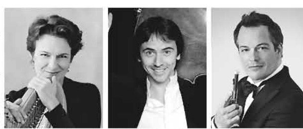
M. ラングラム (ハープ) J. クラス (チェロ) E. パユ (フルート)

の活躍を続けるチェロ のプリンス「ジャン ギアン・ケラス」、ベル リン・フィルの首席奏 者にしてハーブの女王 「マリー・ピエール・ ラングラメ」、三人のス ーパースターが松本に 結集する一夜限りのド リームコンサートです。 ソロあり、デュオあり、 トリオありの至福の一 夜をお楽しみください。 現代を代表する作曲家 で昨年逝ったヘンツェ、