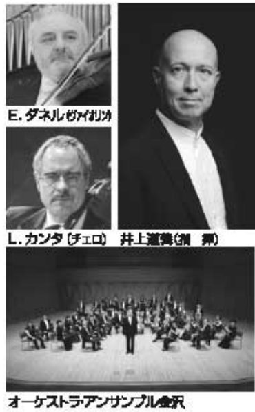
オーケストラアンサンブル金沢

12/21 土 オーケストラアンサンブル金沢 松本公演 上二大作曲家の究極の名曲を井上道義の指揮で ■メインホール ■14:00